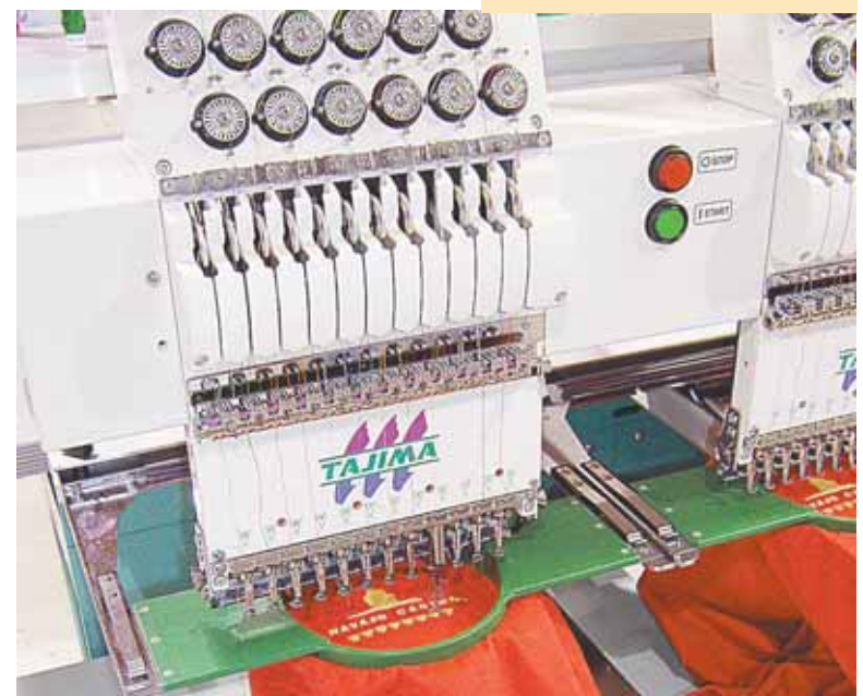
La maquinaria automatizada más moderna.

Super Embroidery y Screenprinting Ubicada en: 4140 E. Winslow, Avenue (Al sur de la 42 calle y la University), Phoenix, Arizona. 85040 Teléfono: (602)453-9800 Fax: (602)453-9882