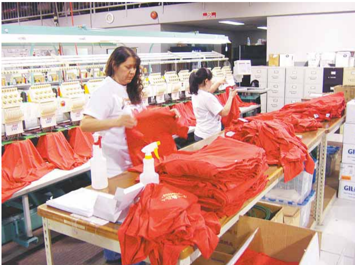
La gente hispana contribuye con su esfuerzo a la empresa Super Embroidery y Screenprinting.

Cuando hay un tiempo de crisis económica, cualquier empresa disminuye inmediatamente lo que invierte en publicidad y mercadeo, tratando de ahorrar gastos y sacrificando la presencia de su negocio