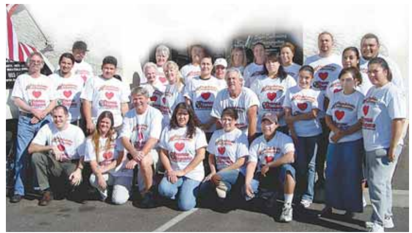
El personal de Super Embroidery y Screenprinting posa para la foto, luciendo las camisetas que imprimieron especialmente para la entrevista con Prensa Hispana.

Super Embroidery y Screenprinting, imprimen o bordan los trabajos que sus propios vendedores o compañías les consiguen, sin sacarlo ellos al mercado